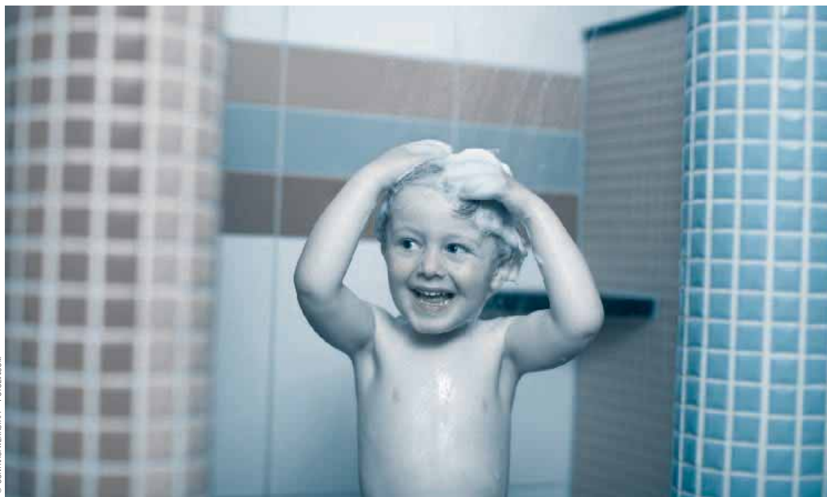
Les douches de huit stades et gymnases ont déjà été rénovées.

Le saviez-vous : depuis quatre ans, les agents municipaux rénovent les douches des gymnases et stades. Objectif : améliorer votre confort, mais aussi prendre soin de l'environnement.