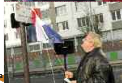
1• Inauguration du nouveau supermarché Carrefour dans la Zac Concorde-Stalingrad, le 1 er mars. 2• Carnaval des centres de loisirs primaires, le 2 mars. 3• Inauguration des nouvelles rues dans le quartier Balzac, le 5 mars.