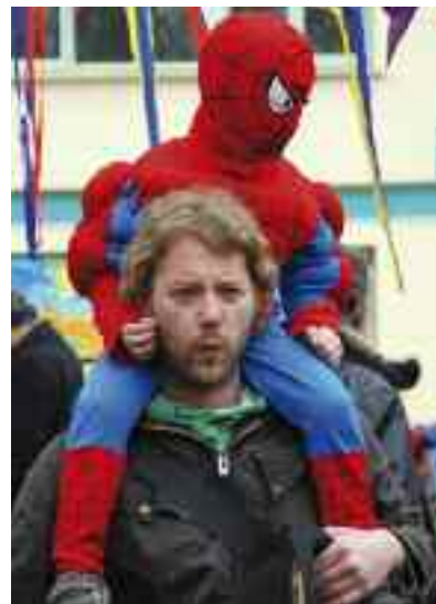
► Ambiance au carnaval des centres de loisirs maternels, le 12 mars.