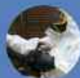
désinsectisation désinfection dératisation