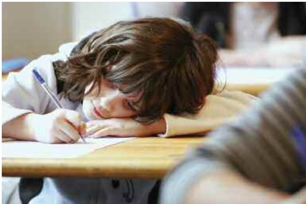
La dictée en famille organisée par le Centre culturel de Vitry, le 19 mars.