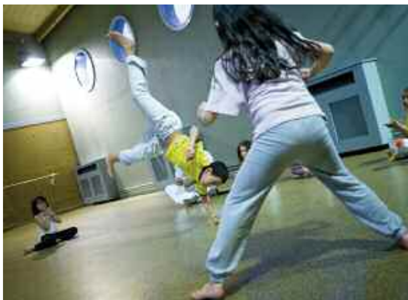
Cours de capoeira au gymnase du Port-à-l'Anglais, le 9 mars.