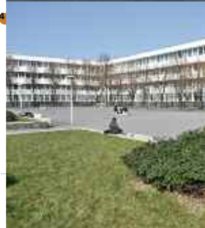
1• Aménagement de la cour intérieure avant d'accueillir les premiers élèves du lycée Jean-Macé, septembre 1963 2• Inauguration du lycée technique Jean-Macé d'Ivry-Vitry, le 15 février 1967 3• Ateliers industriels, dans les années soixante 4• Le lycée aujourd'hui.