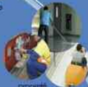
propreté travaux exceptionnels

LASSERRE Propreté Tél. 01 46 80 25 14 - Fax : 01 45 73 94 16 10 Place du 19 Mars R62 - 94400 Vitry sur Seine lasserre.propreté@yahoo.fr