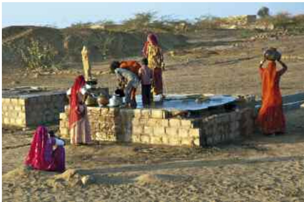
Puits dans la région de Jaisalmer en Inde.

Le Gange est l'invité d'honneur du Festival de l'Oh ! qui fera escale à Vitry les 18 et 19 juin. Le 26 avril, les Mardis de l'eau seront consacrés au captage des eaux de pluies en Inde.