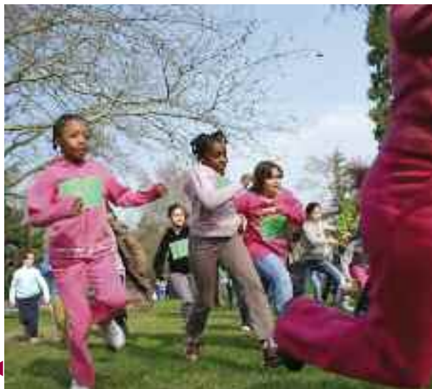
Le Cross des Blondeaux en rose, le 16 mars. ▼