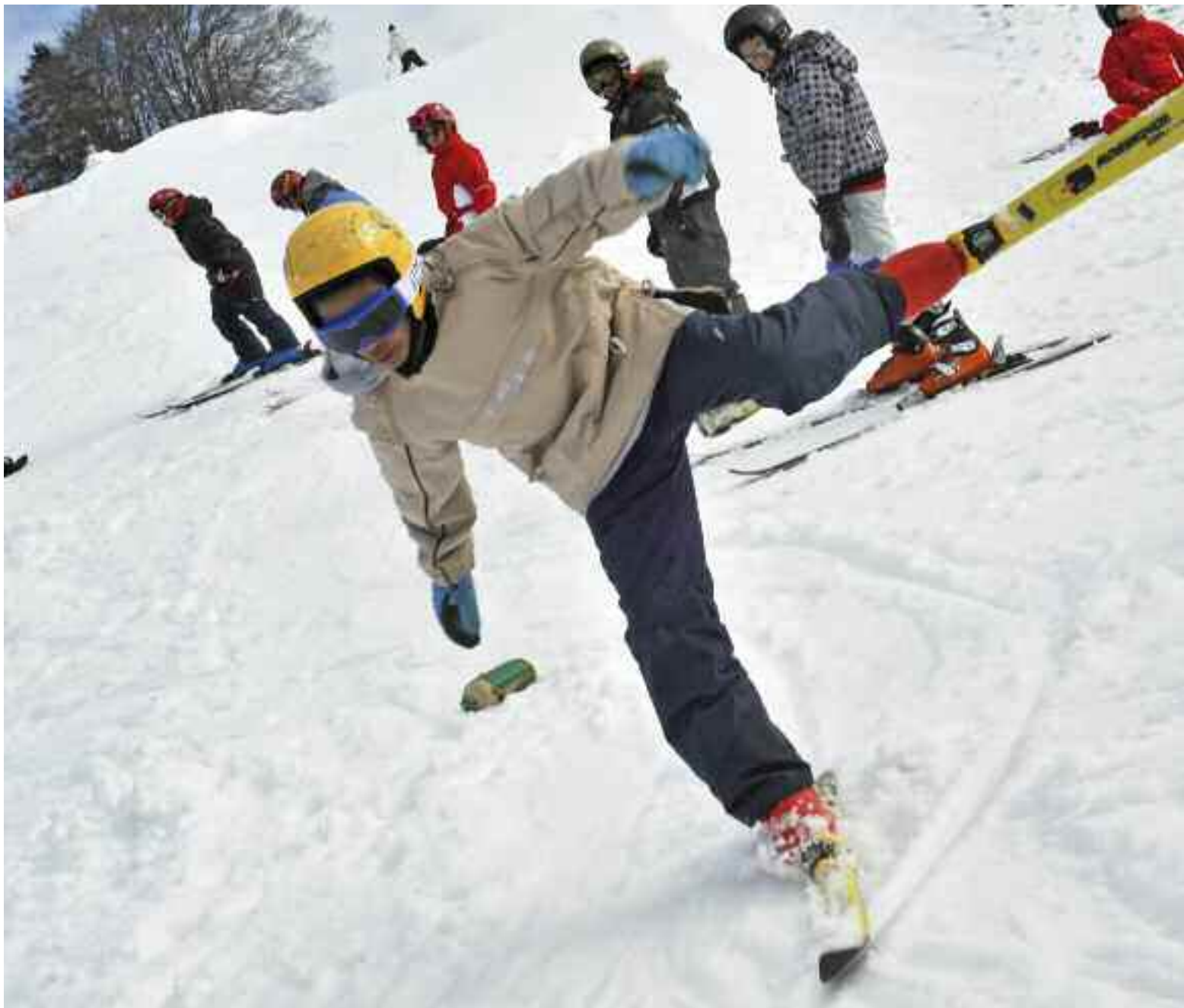
▼ Séance de monoski au centre de vacances de Méandre, le 22 février.