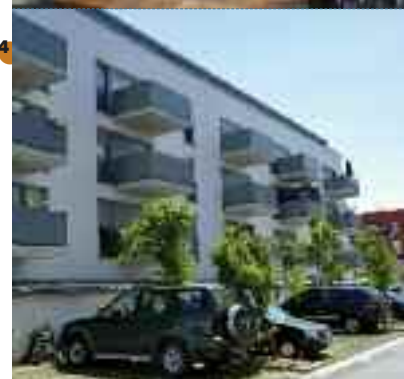
1• Exposition sur les projets d'aménagement de la Semise, en 1970. 2• Construction des grands ensembles du centre ville dans les années 1970. 3• Fête du Plateau, cité Colonel-Fabien en 2007. 4• La Baignade, une des dernières livraisons de la Semise.