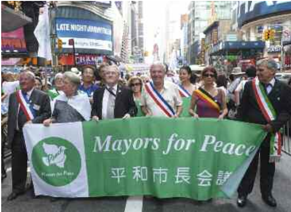
Manifestation pour le respect du Traité de non prolifération des armes nucléaires dans les rues de New York le 2 mai.

initiatives de la Ville pour une culture de Paix : les expositions sur les bombardements atomiques avec des témoignages des maires de Nagasaki et d'Hiroshima, sur le livre de Michel Aguilera, les manifestations organisées autour de la journée de la Paix en septembre, l'édition d'ouvrages comme Les plus beaux poèmes pour la Paix , les campagnes autour de la carte pétition intitulée "les villes ne sont pas des cibles", les actions concrètes de coopération avec le Mali, le Sahara occidental, la Palestine... Le maire a par contre déploré l'attitude de la France : "Même si notre pays n'a pas augmenté le nombre de ces ogives, le budget destiné à l'armement a considérablement augmenté alors même que les l'État réduit dans tous les