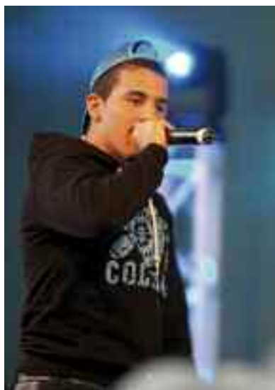
Concert de lancement de la compilation Avec vous, au gymnase Joliot-Curie, le 15 mai.