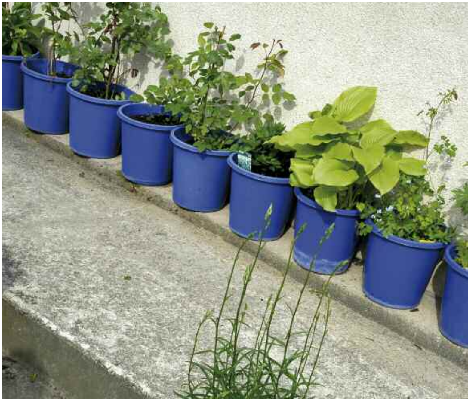
▼ Plantations chez Tatiana Graviloff.