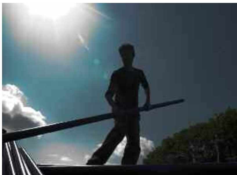
Montage du chapiteau pour le festival Sur les pointes, le 20 mai.