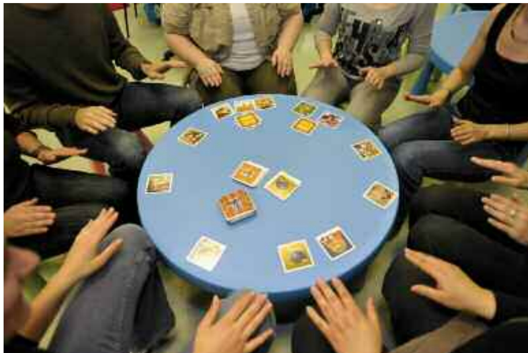
Atelier Jeux à la ludothèque Les souriceaux, le 14 mai.