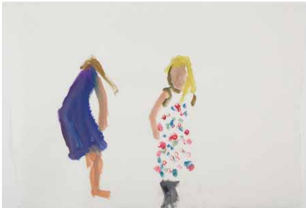
Damien Cabanes Zoé dansant avec Cécile, 2010/ Gouache sur papier/ 148x115cm/ collection de l'artiste.

L'exposition Support papier réunira quelques œuvres de Pierre Buraglio et de Damien Cabanes. Une rencontre plastique qui esquissera un pont entre deux générations d'artistes.