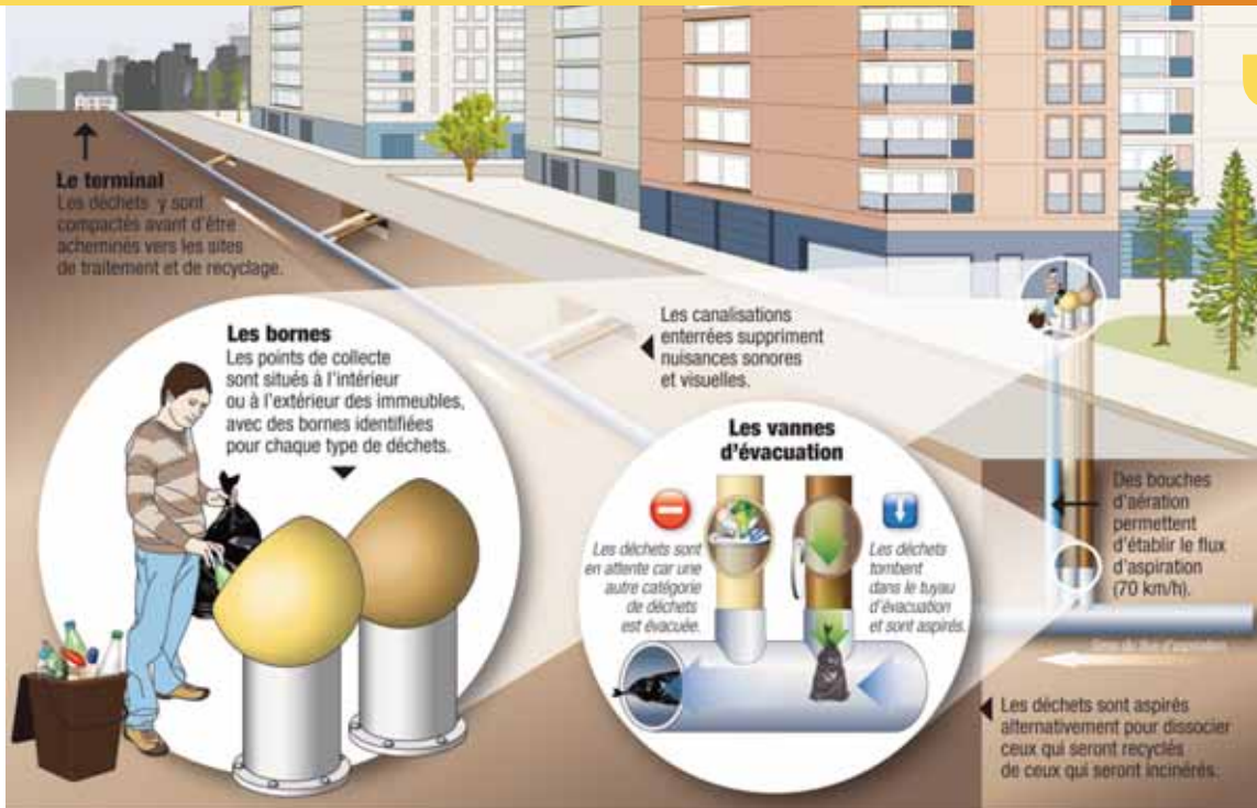
FRANÇOIS LE MOËL/IDEE GRAPHIC