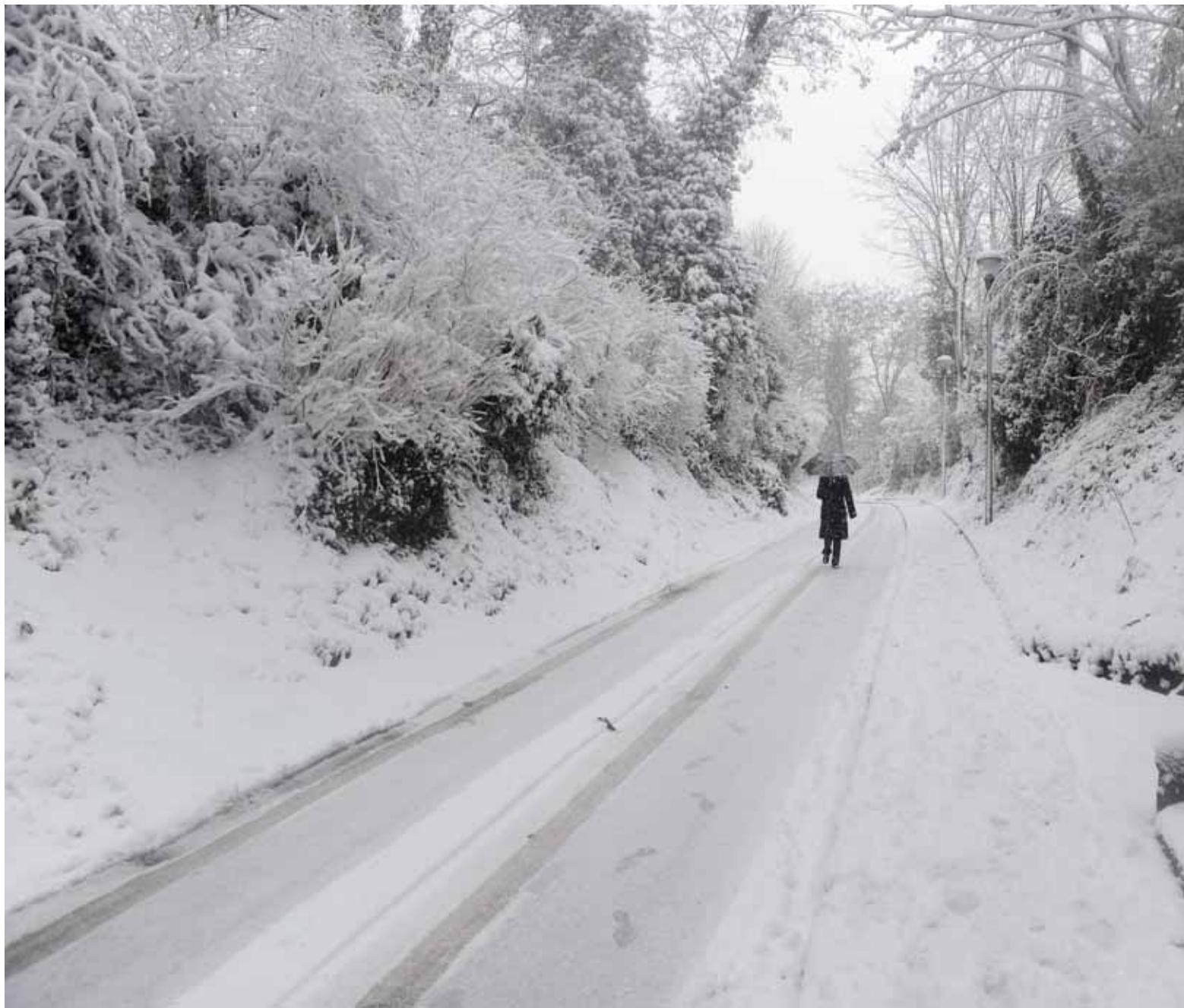
▼ Vitry-sous-neige, rue de la Petite-Saussaie, le 8 décembre.

De la brouette au tractopelle, tous les moyens sont bons pour déneiger les routes, le 20 décembre.