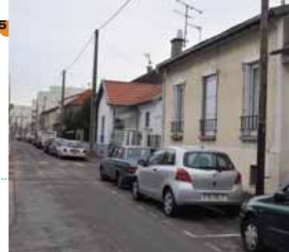
1* ... dans un petit pavillon de la rue Talma... (Tonino Benacquista). 2* Enfin j'arrive au fameux rond-point... (Micheline Hermine). 3* Et j'ai retrouvé la rue Anselme-Rondenay (Tonino Benacquista). 4* ... l'énorme usine EDF dressait ses deux cheminées géantes à l'assaut de la nuit (Tonino Benacquista). 5* ... une maisonnette triste et sans attrait [...] sur les quais de Vitry, rue d'Algésiras (Maurice G. Dantec).