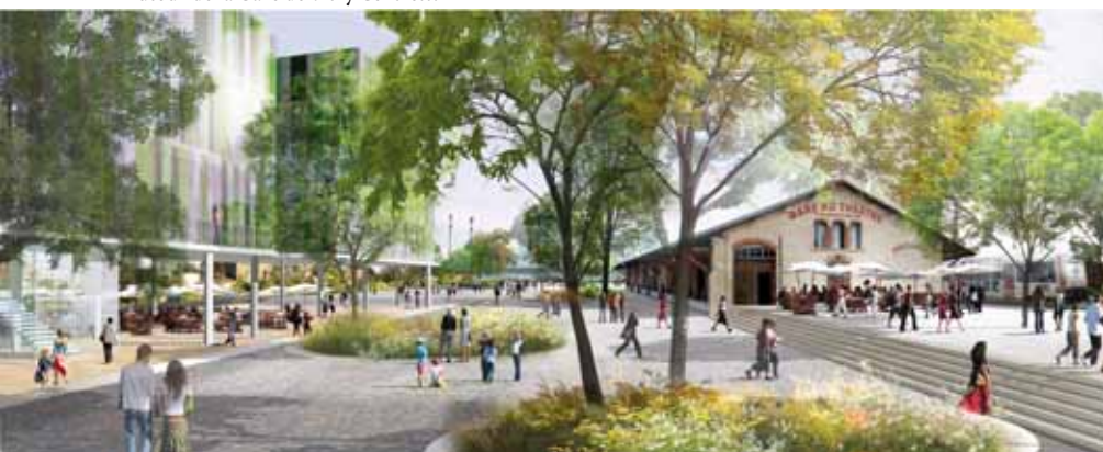
Autour de la Gare de Vitry Centre...