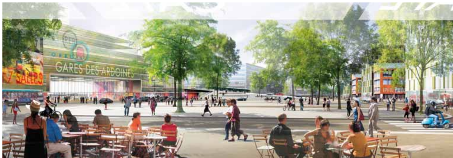
Autour de la Gare des Ardoines...